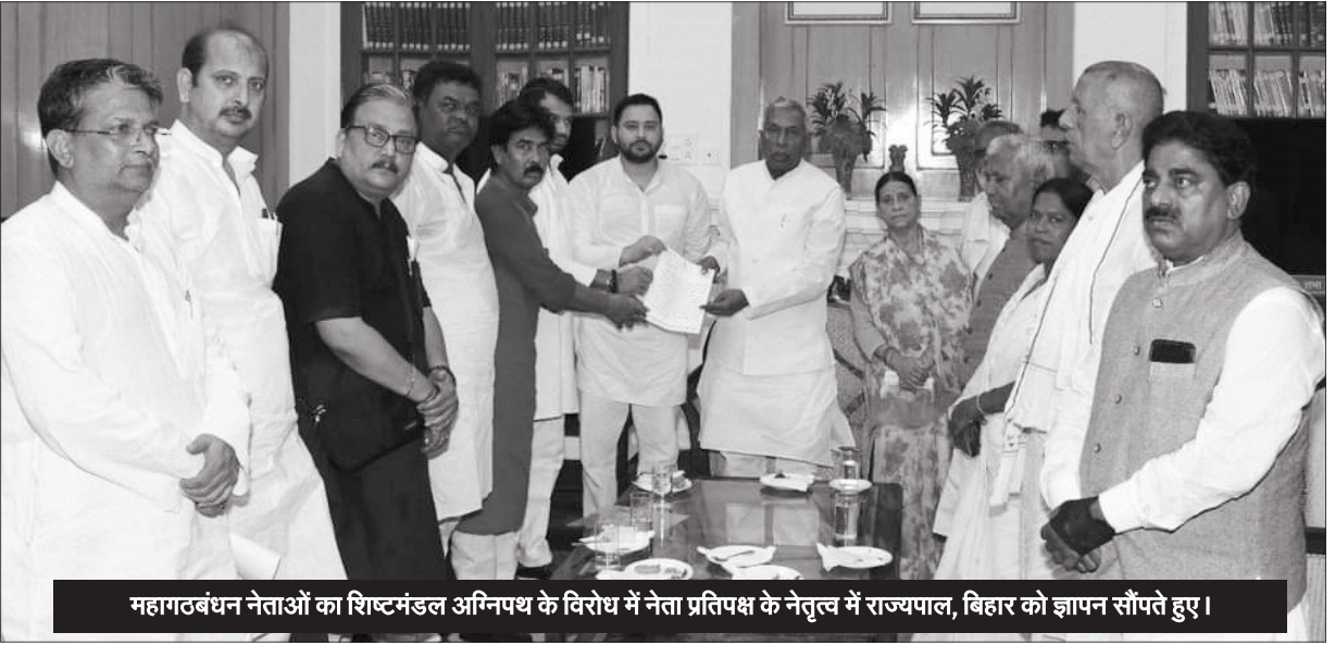
महागठबंधन नेताओं का शिष्टमंडल अग्निपथ के विरोध में नेता प्रतिपक्ष के नेतृत्व में राज्यपाल, बिहार को ज्ञापन सौंपते हुए।

पाया। ऐसे में अग्निवीर को नौकरी दिलवाने की बात सिर्फ जुमला है।