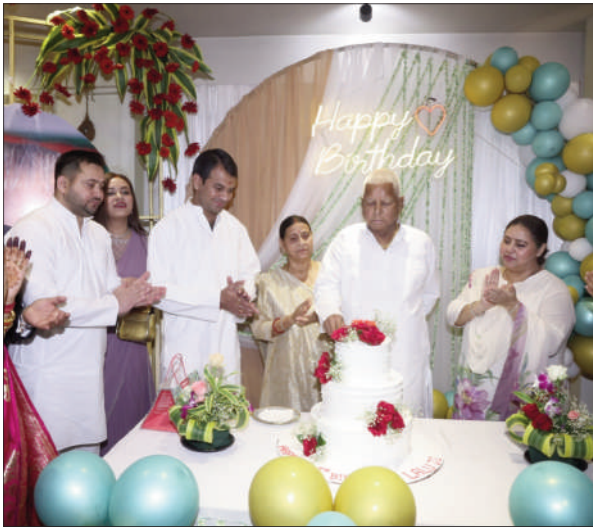
पारिवारिक के सदस्यों के बीच लालू प्रसाद : जन्मदिन का केक काटते हुए।