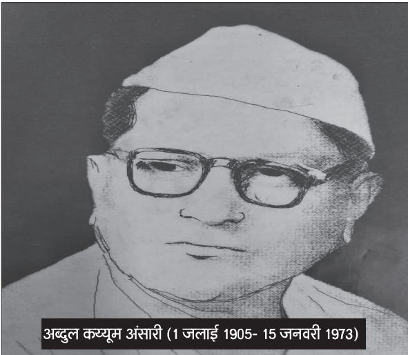
अब्दुल कय्यूम अंसारी (1 जलाई 1905- 15 जनवरी 1973)

के काम को जल्द से जल्द निपटाने के लिए अब्दुल कय्यूम अंसारी द्वारा तैयार की गई योजना के बारे में गांधी जी ने उनसे कई बार बातचीत भी की। बाद में अपने विचारों को टिप्पणी के रूप में उनके मार्गदर्शन के लिए लिखा। गांधी जी ने ये टिप्पणी बिहार छोड़ने से पहले 24 मई, 1947 को लिखी थी।