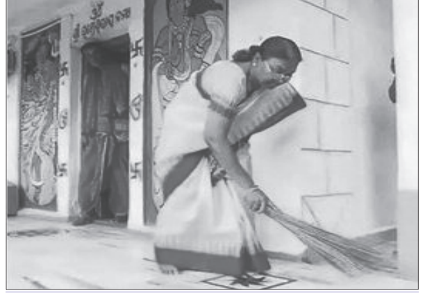
देवघर स्थित एक शिव मंदिर में झाड़ू लगाती द्रौपदी मुर्मू

यह सच है कि द्रौपदी मुर्मू आदिवासी समुदाय से आती हैं। आदिवासी समुदायों के बीच चल रहे तमाम संसाधन आधारित बहसों के बीच एक तरफ भाजपा इन समुदायों के बीच अपने सामाजिक आधार को व्यापक बनाने की कोशिश कर रही है। दूसरी ओर आदिवासी संगठनों लगभग दो दशकों से आदिवासियों के लिए अलग धर्म कोड का पुरजोर मांग कर रहे हैं। इसे हिंदूवादी संगठन अपने लिए खतरा मान रहे थे। उदाहरण से झारखंड और झारखंडी आदिवासियों ने अपने लिए अलग 'सरना धर्म कोड' को शामिल करने की मांग की है। इसी तरह अन्य राज्यों में भी आदिवासी धर्म कोड की बात उठी है। झारखंड के पूर्व मुख्यमंत्री शिबू सोरेन और वर्तमान मुख्यमंत्री हेमंत सोरेन ने खुलकर इस मांग का समर्थन किया है। हाल ही के वर्षों में हेमंत सोरेन ने कई बार दृढ़ता के साथ दावा किया है कि 'आदिवासी कभी हिंदू न थे, और न होंगे।' इस कथन का भाजपा पुरजोर विरोध करती आ रही है। इस मामले में अंतरराष्ट्रीय समुदाय भी खामोश नहीं है। ऐसी परिस्थिति दुनिया के अनेक देशों के आदिवासी-मूलनिवासियों के साथ भी है। उनसे अधिकतर देशों में वहां की सरकारों ने इन मांगों को स्वीकार भी कर लिया है। इस मसले पर