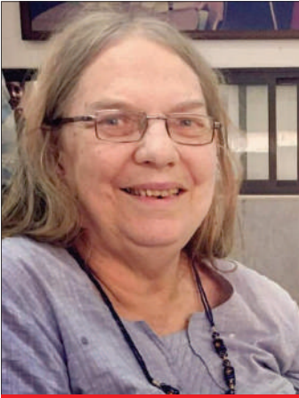
गेल ओम्बेट (2 अगस्त 1941- 25 अगस्त 2021)

प्रतिनिधित्व कर रहे थे, भारतीय इतिहास में थे। इस संघर्ष में ताकत भी थी, हिंसा भी थी, राजनीतिक जोड़-तोड़ भी था और विचारधारा की धोखाधड़ी की आंशिक व्यवस्था का निर्माण तथा उसकी रचना के प्रयास भी थे।