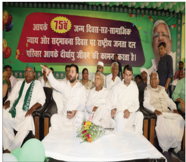
राजद कार्यालय में लालू प्रसाद का जन्मदिन उत्सव।